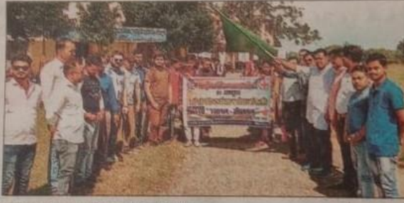
स्वयंसेवकों ने रक्तदान दिवस पर निकाली रैली।